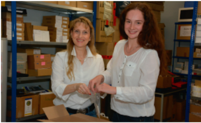
Schneller Versand von Verbrauchsgütern gehört bei KL Trend zum Service.