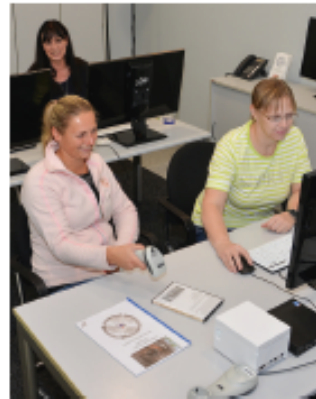
... die Praxis mit Scanner und Co. ein weiterer.

TSP EDV Org. GmbH Obermassener Kirchweg 3 59423 Unna Tel. 02303 / 25 41 97 Fax 02303 / 25 41 99 info@tspedv.de www.kltrend.de